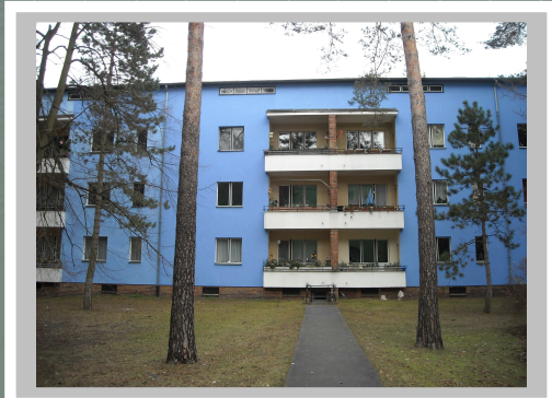
Onkel-Toms-Hutte Housing Estate, Berlin. |Germany. 1920 年代にドイツで建てられた労働者のための近代的なアパート。住宅デザインと近代福祉政策の発展のパイオニア的な役割を果たした。

The London School of Economics and Political Science (LSE) 博士課程卒業, PhD in Regional Planning. 日本の大学を卒業後、営業職から米国への語学留学、大手外資系企業の役員秘書職を経て、英国の大学院で公共政策の博士号を首席 (Distinction) で取得。米国のロータリー財団と南オーストラリア州政府からフェローシップを得て、カナダの The University of British Columbia、豪州の The University of Adelaide の都市政策研究科に客員研究員として留学。主に国際学術雑誌及び欧米の出版社から研究成果を発表し、国際学会での受賞等、高い評価を得ている。過去 19 年間に、日本及び海外で政府、シンクタンク、大学等の依頼を受け、リサーチャーとして政策調査に従事。現在は社会人/学生の英語及び論文の指導を担当。また帰国生の進学指導でも実績を上げている。